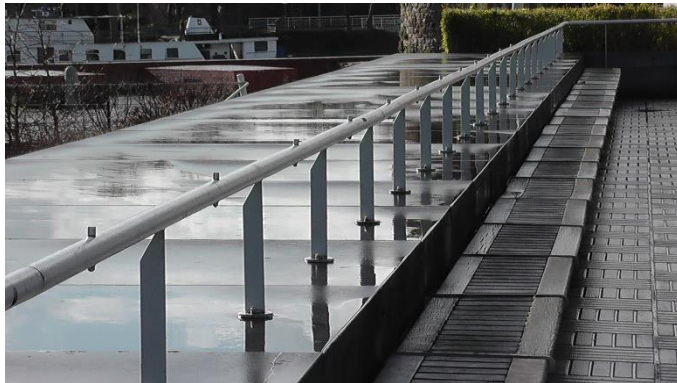
Skatestoppers aangebracht op een reling in de openbare ruimte om ervoor te zorgen dat skaters er niet over heen kunnen slide of grinden.

Definitie: "Openbare ruimte is de gemeenschappelijke fysieke ruimte die leden van een samenleving hebben, inclusief de daarop betrekking hebbende mentale en sociale ruimte".