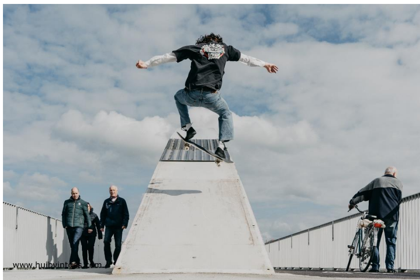
De boog van de loopbrug in het centrum van Maastricht wordt hier gebruikt door een skater als obstakel om op te skaten, een voorbeeld van een andere functionaliteit die men kan vinden in de openbare ruimte.