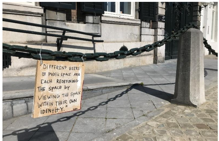
"Different users of public space are each redefining the space by viewing the space within their own identity."

om een ontmoeting, waarin je iedereen in principe kan ontmoeten. Maar deze ontmoeting is alleen mogelijk als iedereen, en elke groep ook daadwerkelijk welkom en gelijkwaardig is in de openbare ruimte. Dit is helaas niet het geval. Skaters worden bijvoorbeeld verwijderd uit de openbare ruimte. Niet alleen door middel van het geven van boetes of sancties, die opgelegd worden tegen skaters, maar ook door de architectuur bewust aan te passen dat het skateboarden haast onmogelijk maakt (zie afbeelding). Je zou dus wel degelijk kunnen stellen dat niet iedereen welkom is in de openbare ruimte, terwijl zij dit wel