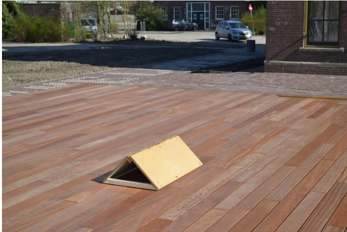
Een skatebaar object geplaatst in de binnenstad van Maastricht.

Ik probeer hierop te reageren, door op plekken in de openbare ruimte skatebare objecten te plaatsen (afbeelding 3). Deze objecten zijn niet typische skateobstakels of iets wat er misschien op